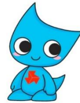
インターハイ マスコットキャラクター ウイニンくん

大会では競技に参加する高校生だけではなく、大会を支える高校生や地域の方々も参加して、北部九州ブロック(福岡・佐賀・長崎・大分)で開催準備・運営に取り組み、全国から訪れる多くの人を「おもてなし」の心で迎え、本県を訪れた人々の記憶に残る大会を目指しています。